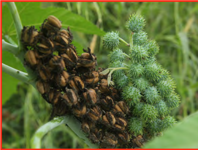
Castor-Oil dry seed pods

Instrucciones: Aplastar semillas u hojas y hervir en 1 litro de agua durante 20 minutos. Deje reposar la mezcla durante la noche (24 horas). Filtrar y rociar para controlar el marchitamiento por Fusarium, Tizón Sureño, la antracnosis, la podredumbre y los nematodos.