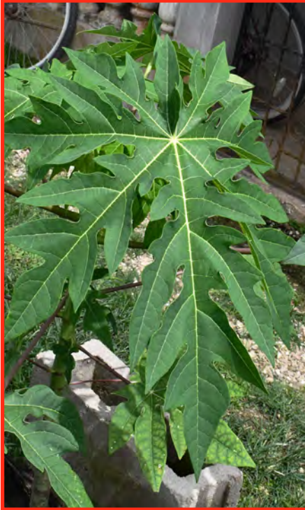
Papaya plant and leaves

Instrucciones: Marinar 1 kilogramo de hojas frescas en un litro de agua. Filtra y diluye un litro de ese extracto en 5 litros de agua. Luego, aplique para el control del moho y el óxido de los frijoles.