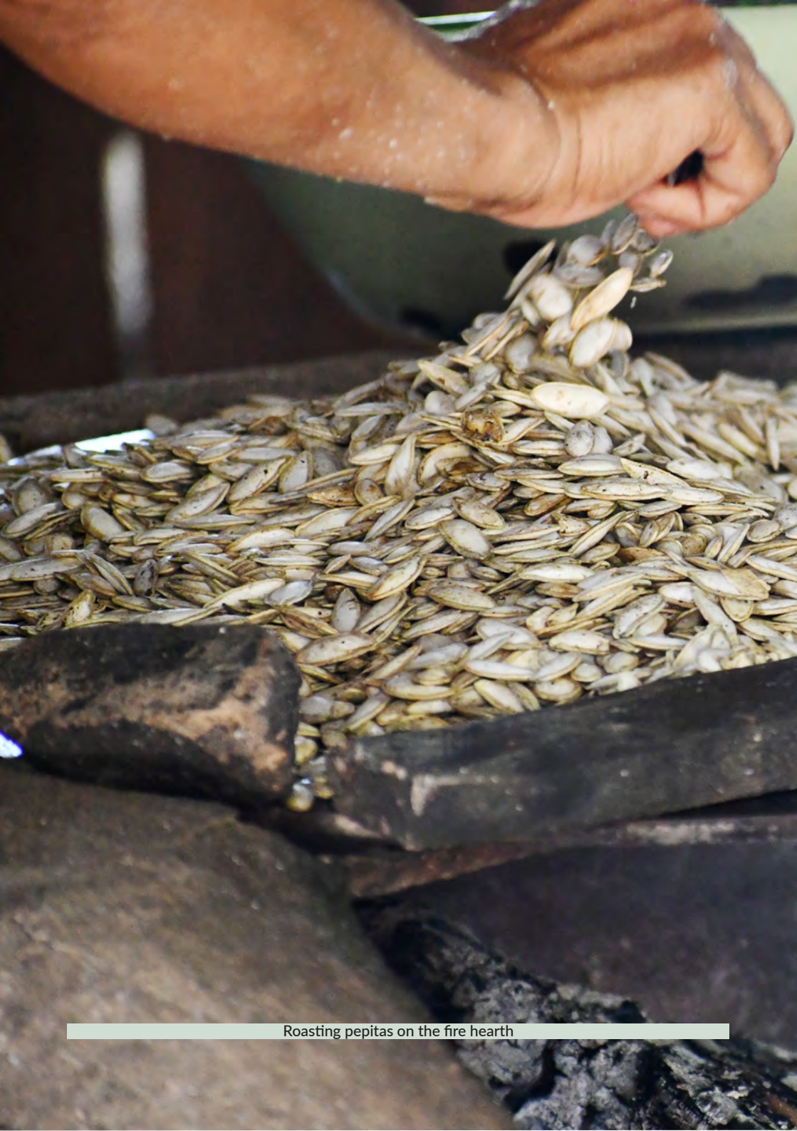
Roasting pepitas on the fire hearth