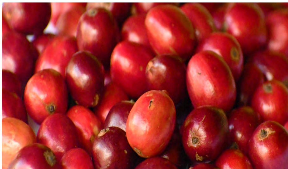
Local coffee beans