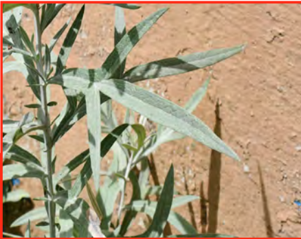
Incense plant and leaves

Instrucciones: Tome 30 gramos de hojas secas; hervir en 1 litro de agua durante 15-20 minutos. Enfriar y diluir en 10 litros de agua. Filtre y rocíe para controlar áfidos, orugas, plagas de almacenamiento como los gorgojos.