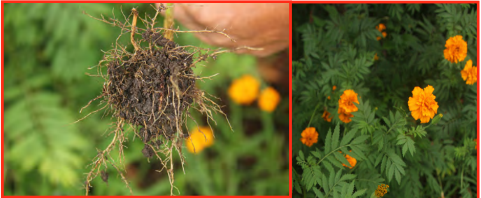
Marigold roots, flowers and leaves

Instrucciones: Hervir 200 gramos de flores y raíces en 5 litros de agua durante 30 minutos. Filtrar y aplicar para áfidos, mosca blanca, orugas, nematodos y óxido de frijol.