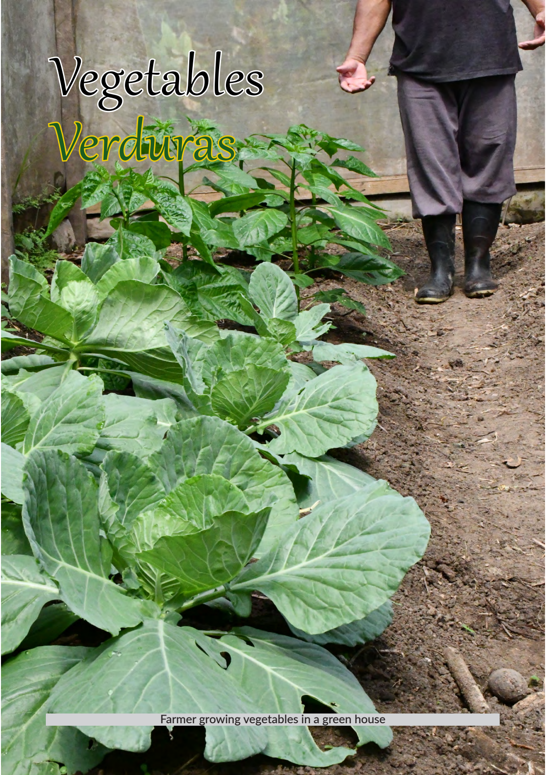
Farmer growing vegetables in a green house