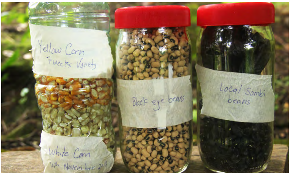
Properly labeled seeds containers

*Consejo de almacenamiento: etiquete las semillas con su nombre, fecha y año en que fueron almacenadas. Determine la “fecha de vencimiento” para esas semillas en particular e inclúyala también en la etiqueta.