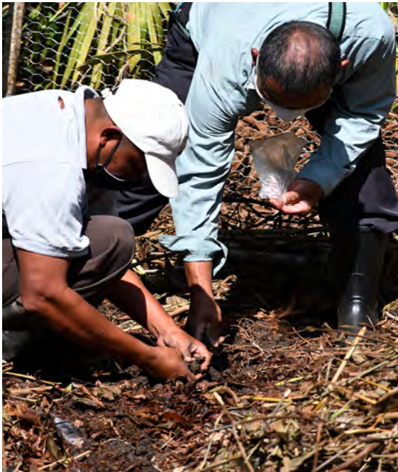
Farmers planting in an inga alley cropping plot

Nota: Mantenga cada cultivo libre del ataque de plagas, enfermedades y malezas.