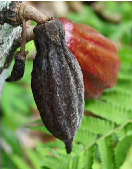
Monilia in cacao

El cacao es un cultivo de importancia económica para las comunidades dentro del MGL. Las condiciones climáticas y los tipos de suelo también son ideales para este cultivo y se puede cultivar en un sistema agroforestal. Cuando un sistema agroforestal está diseñado adecuadamente, debe contribuir al equilibrio natural dentro de los ecosistemas. En los casos en los que aumenta la humedad, la circulación de aire es limitada y no hay suficiente luz solar, los patógenos pueden descontrolarse. Esto sucede en el caso de Monilia y Phytophthora en el cacao, dos enfermedades comunes del cacao causadas por hongos. Las buenas prácticas de campo, como el control de malezas, la poda y el manejo de la sombra, reducen los impactos de estas enfermedades en los rendimientos del cacao.