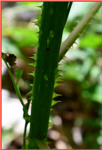
Nettle stem and leaf

Instrucciones: Tomar 100 gramos de hojas frescas. Triturar y diluir en 10 litros de agua. Reposar durante 4 días. Filtrar y aplicar para el control de áfidos.