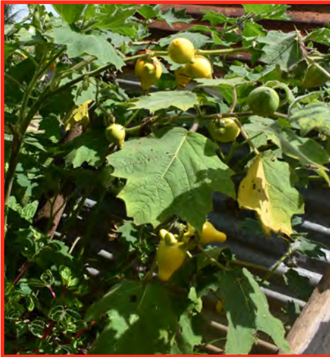
Nipplefruit fruits and leaves

Instrucciones: Aplastar y pulverizar 100 gramos de frutas y semillas. Diluir en 1 litro de agua. Reposar de 6 a 8 horas. Filtre y aplique para controlar los caracoles, las babosas, los áfidos y las orugas.