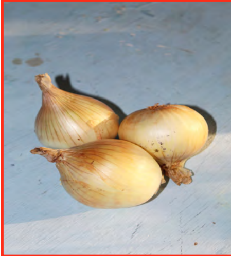
Onion leaves and root

Instrucciones: Diluir 100 gramos de cebolla triturada en 1 litro de agua y dejar reposar en un recipiente bien tapado durante al menos 3 días. Rociar para el control de áfidos ( Brevicoryne brassicae , Myzus persicae , Aphids gossipii , Aphis craccivora ), ( Plutella xylostella y ( Tetranychus spp.) También para el control de 'damping off', tizón temprano ( Alternaria solani , Alternaria tenuis ), tizón tardío ( Phytophthora infestans ), Aspergillus niger , moho gris ( Botritis especies), Curvularia lunata , Diplodia maydis , Colletotrichum especies, Xanthomonas especies, Erwinia especies y Mancha Bacteriana ( Pseudomonas especies), así como para ratones y topos.