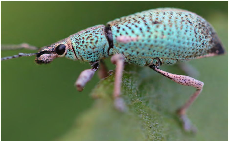
Coffee borer small weevil