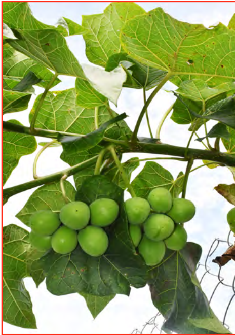
Jatropha leaves and fruits

Instrucciones: Aplastar un puñado de hojas secas y remojar en etanol. Diluir en 1 litro de agua. Filtrar y rociar para el control de Praticolella griseola .