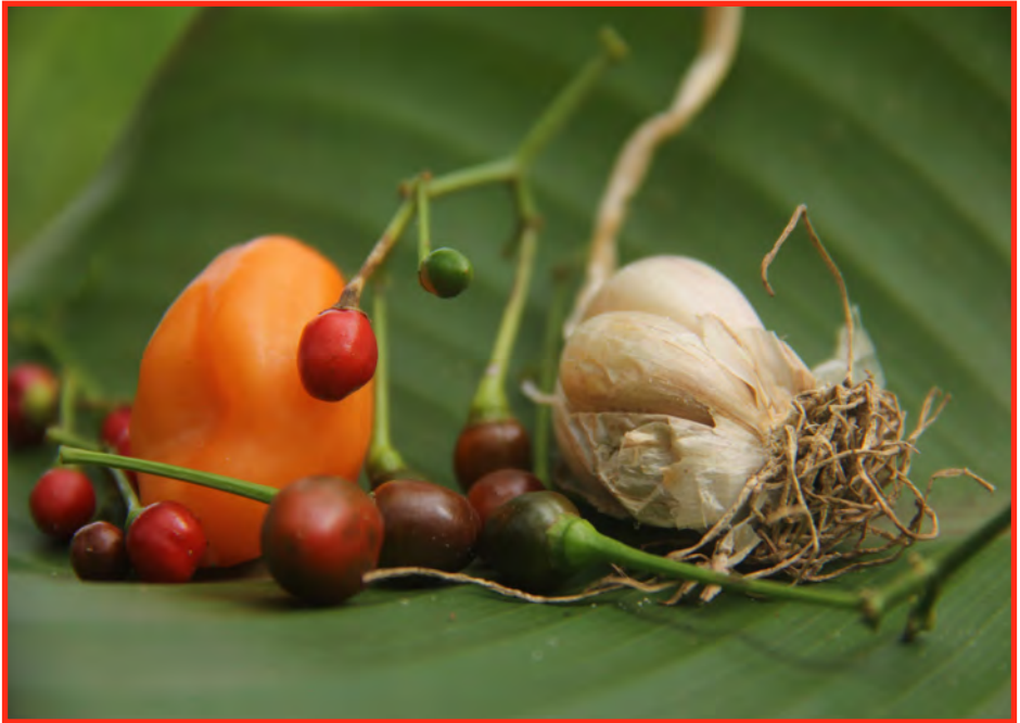
Hot peppers and garlic

Instrucciones: Mezclar 250 g de pimienta y ajo respectivamente en 1 litro de agua. Déjelo reposar durante 24 horas, filtre y diluya en 5 galones de agua. Aplicar para el control de babosas, caracoles y orugas.