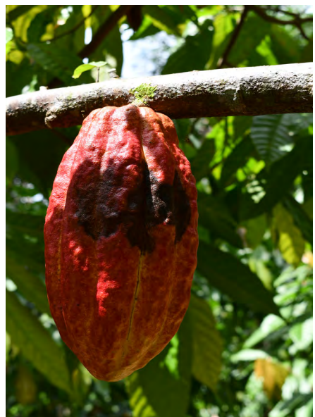
Phytophthora in cacao