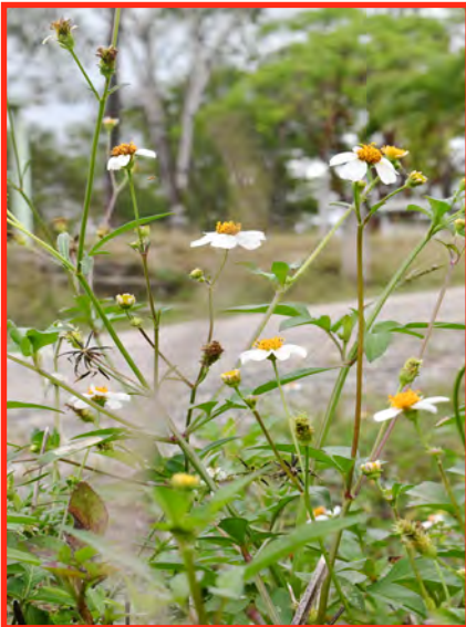
Chamomile plant and flowers

Instrucciones: Tome 500 gramos de hojas frescas y flores. Aplastar y diluir en 5 litros de agua, dejar reposar durante 24 horas. Agregue una cucharada de jabón líquido. Filtrar y rociar para controlar la mancha foliar angular ( Pseudomonas especies), la podredumbre blanda bacteriana ( Erwinia especies) y la podredumbre negra ( Xanthomonas especies).